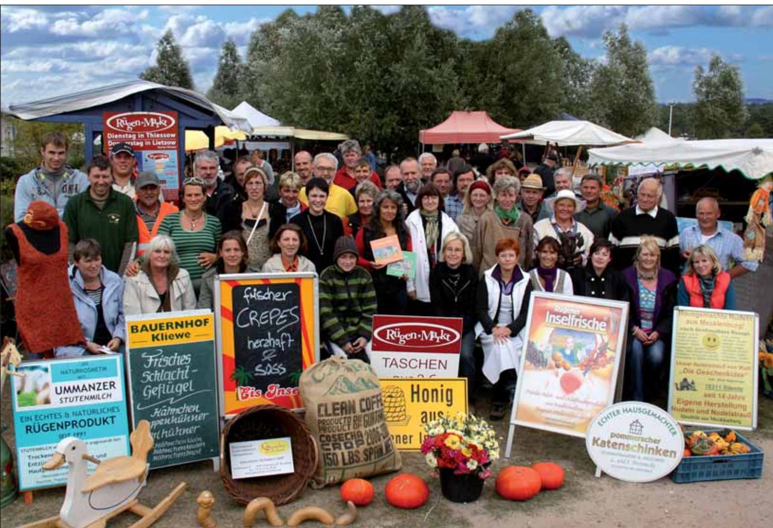
Die Kunsthandwerker und regionalen Produzenten von der Ostsee-Insel Rügen freuen sich ab 6. Februar auf die Besucher im VITA-CENTER. Es ist das erste Mal, dass der Rügen-Markt „on tour“ ist.

Rügen-Markt im Hafen des idyllischen Lotsendorfes Thiessow: Sehen, riechen, schmecken