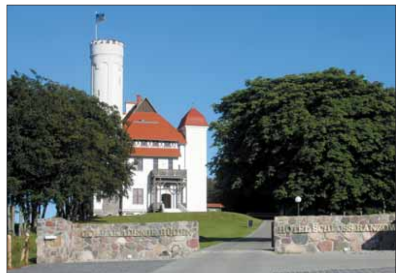
Das Hotel Schloss Ranzow auf der Halbinsel Jasmund wurde im vergangenen Jahr neu eröffnet.

Schloss Ranzow auf der Halbinsel Jasmund Rügen für Romantiker