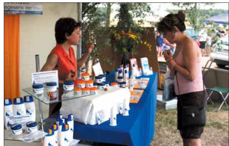
Rügen-Kosmetik setzt bei der Herstellung der Pflegeprodukte auf Stutenmilch und Heilkräuter auf eine sehr hohe Qualität.

1991 sollte die Haflingerzucht Ummanz „abgewickelt“ werden. Man suchte nach einem Ausweg, wollte die bekannte Pferdezucht erhalten. Ein Hautarzt und eine Apothekerin kamen auf die Idee, uraltes Wissen wieder nutzbar zu machen und die vielen positiven Eigenschaften der Stutenmilch als qualitativ hochwertige Hautpflegemittel und therapeutische Substanzen bei Hauterkrankungen zu nutzen. Unter ständiger Aufsicht des Veterinäramtes wird seitdem Vorzugsmilch gewonnen und zu Rügen-Kosmetik Produkten veredelt. Die Pferdezucht auf der Insel Ummanz, zwischen Rügen und Hiddensee gelegen, konnte so erhalten werden. Die Stuten umweht täglich die reine Ostseeluft. Sie grasen auf den gesunden Weiden mit saftigem und gehaltvollem Grün. Dadurch sind die Tiere gesund und entspannt, und die Stutenmilch hat einen optimalen Gehalt an den besonderen, wirksamen Inhaltsstoffen. Stutenmilch weist aufgrund der antibakteriellen und entzündungshemmenden Bestandteile, der Euterbeschaffenheit der Stuten deutlich weniger Keime auf als Kuhmilch. Außerdem enthält sie weniger allergieauslösende Stoffe. In der Zusammensetzung ist sie der menschlichen Muttermilch deutlich ähnlicher als Kuhmilch. 60 bis 70 Millionen Jahre lag die Rügener Heilkräuter unangetastet im