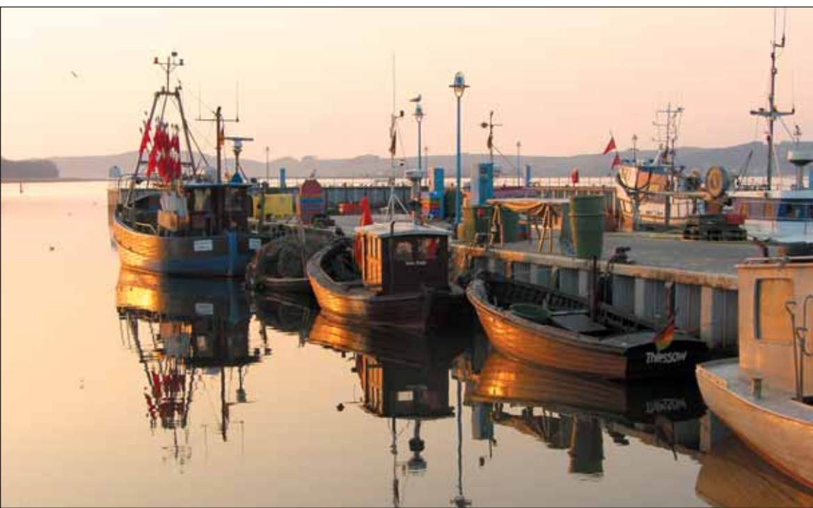
Traumhaft schön: der Sonnenuntergang im Hafen Thiessow.

Im Biosphärenreservat sind Land und Meer tief ineinander verzahnt Natürliche & kulturelle Vielfalt