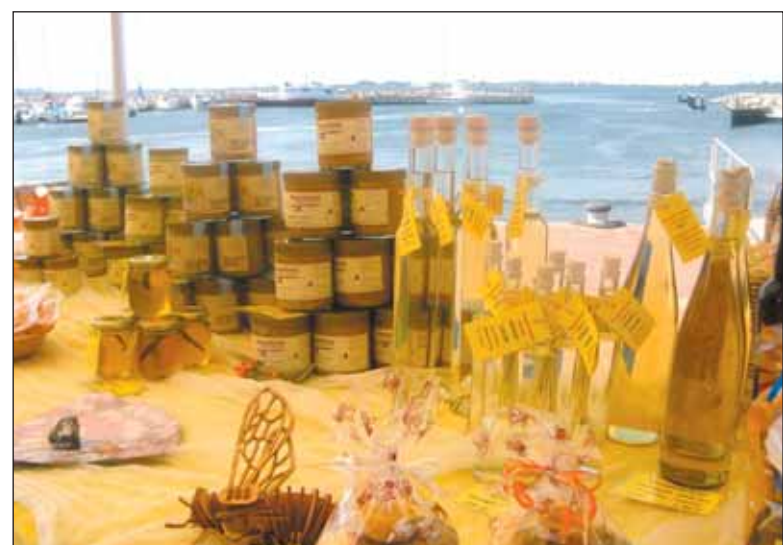
Hausgekelterter Met und Honiglikör gehören neben den selbsterzeugten und veredelten Honigprodukten zum Sortiment.