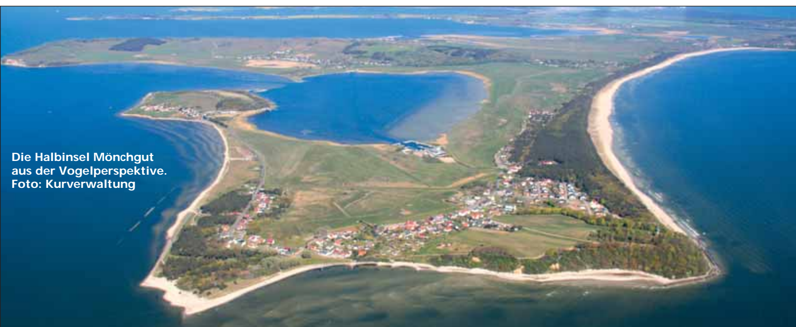
Die Halbinsel Mönchgut aus der Vogelperspektive.

Wer auf der Halbinsel Mönchgut angekommen ist, lernt einen ganz besonderen Teil der Insel Rügen kennen. Sanfte Hügel und flaches Land umschlungen von Bodden und Ostsee, Steil- und Flachküsten mit langen weißen Sandstränden. Das Ostseebad Thiessow mit dem verträumten Ortsteil Klein Zicker fin-